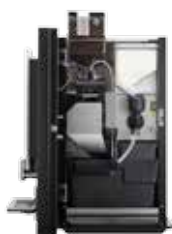
OPTIBEAN 2 (XL) TOUCH