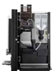
OPTIBEAN 3 (XL) TOUCH