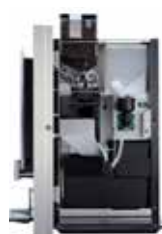
OPTIBEAN 2 (XL)