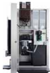
OPTIBEAN 3 (XL)